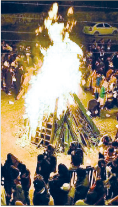
रेवाड़ी। मकर संक्रान्ति पर अलाव जलाकर हाथ संकेत लोग।

मकर संक्रान्ति पर्व पर ग्रामीण क्षेत्रों में मेलों का आयोजन किया गया। इन मेलों में खेलकूद प्रतियोगिताएं भी हुए हैं। डहीना, सींहा, बलवाड़ी व कई अन्य गांवों के मंदिरों में मकर संक्रान्ति पर्व पर आयोजन हुए, जिनमें बड़ी संख्या में लोगों ने हिस्सा लिया। मंदिरों में मेलों के साथ मंडारे भी आयोजित हुए, जिनमें श्रद्धालुओं ने प्रसाद ग्रहण किया।