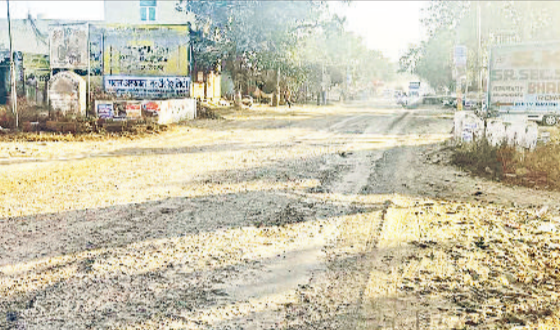
कोसली। आरओबी के पास जर्जर साल्हावास रोड।