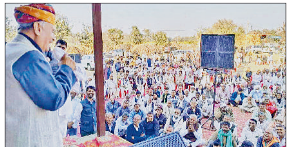
महेंद्रगढ़। ग्रामीणों को संबोधित करते केंद्रीय मंत्री।

गुरुग्राम के सांसद एवं केंद्रीय मंत्री राव इंद्रजीत सिंह ने कहा कि हर परिवार को प्रतिदिन एक रोटी और एक रुपया गोशाला के लिए अवश्य देना चाहिए। सनातन संस्कृति व संस्कारों को अपनाने का आह्वान करते हुए उन्होंने पूर्वजों की तरह गावों की सेवा करने की अपील की। केंद्रीय मंत्री राव इंद्रजीत सिंह बुधवार को खेड़की गांव स्थित बाबा खेतानाथ गोशाला में मकर संक्रांति के अवसर पर आयोजित वार्षिकोत्सव कार्यक्रम को बतौर मुख्यातिथि संबोधित कर रहे थे। उन्होंने कहा कि एक समय था जब