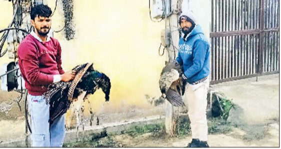
धारुहेड़ा। करंट लगने से जख्मी मोर दिखाते हुए ग्रामीण।

ग्रामीणों ने निगम के प्रति जताया रोष, लोगों ने मोरों को बचाने के प्रयास किए, लेकिन उन्हें सफलता नहीं मिली