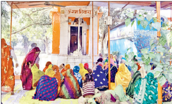
रेवाड़ी। मकर संक्रान्ति पर मंदिर में पूजा-अर्चना करती हुए महिलाएं।

धूमधाम से मना मकर संक्रान्ति पर्व, गावों को चूरमा व गुड़ खिलाया गया