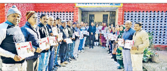
कोसली। शिविर में रक्तदान करते रक्तदाता।

मकर संक्रान्ति के साथ ही बुधवार को खरमास भी समाप्त हो गया है। खरमास के दौरान शादी व दूसरे समारोह अशुभ माने जाते हैं। नए कार्य भी खरमास में शुरू नहीं होते। इस मास की समाप्ति के बाद अब शादी व दूसरे शुभ कार्य भी शुरू हो जाएंगे। ज्योतिषाचारों के अनुसार अब शुभ कार्य शुरू करने का सही समय है।