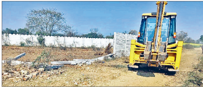
रेवाड़ी। सनसिटी के पास तोड़फोड़ करती डीटीपी की जेसीबी।